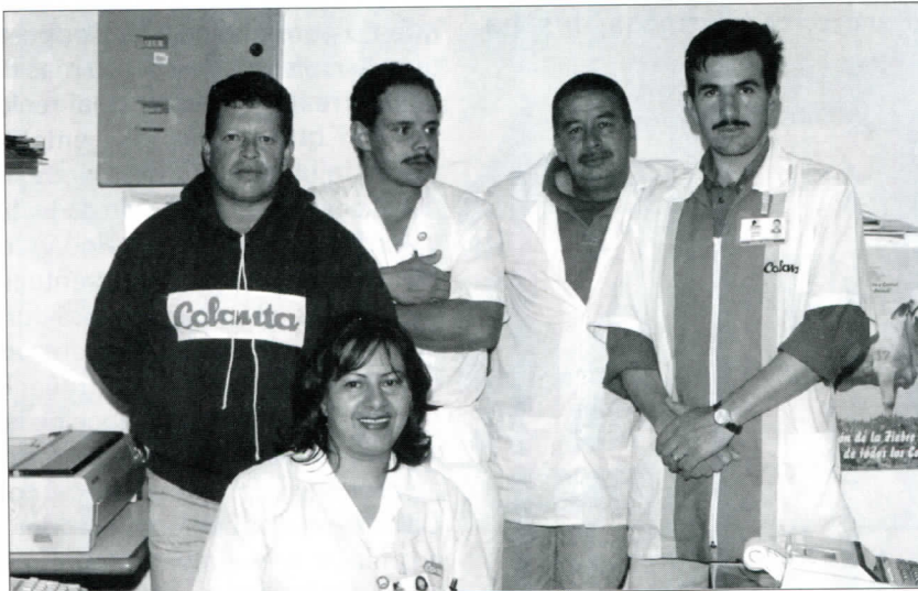
Comité Paritario Santa Rosa

Y muchas otras, pero sólo con su compromiso y con nuestro compromiso lo logramos.