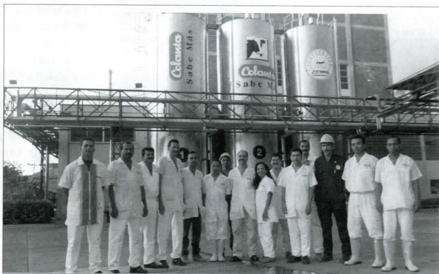
Comité Paritario Planeta Rica