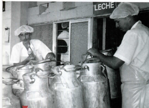
▼ Cada caneca de leche que llega a La Cooperativa se analiza para verificar su calidad.