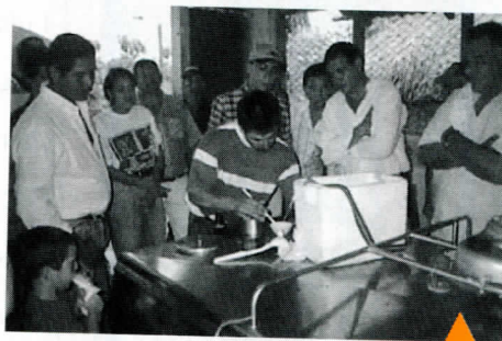
La capacitación también es objetivo del departamento de Mejoramiento y Calidad de la Leche, ya que es pieza clave para mejorar la calidad de vida de nuestros asociados

El transporte y la recolección de leche en finca, tanto de canecas como de tanques, también se controla desde el departamento de Mejoramiento de la Calidad de la Leche. Hoy hay 110 carrotanques, que recogen aproximadamente 850 mil litros en frío. Se manejan 112 rutas de tanques y 240 rutas de canecas aproximadamente.