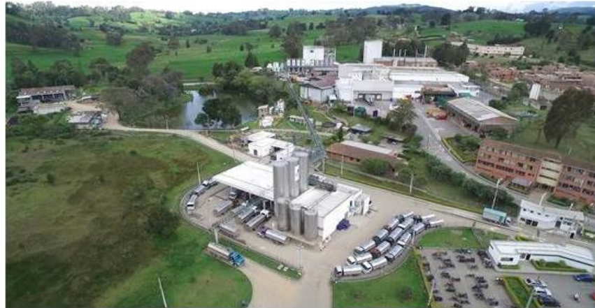
Planta de San Pedro de los Milagros.

POR NATALIA CUBILLOS MURCIA | PUBLICADO EL 20 DE MARZO DE 2019