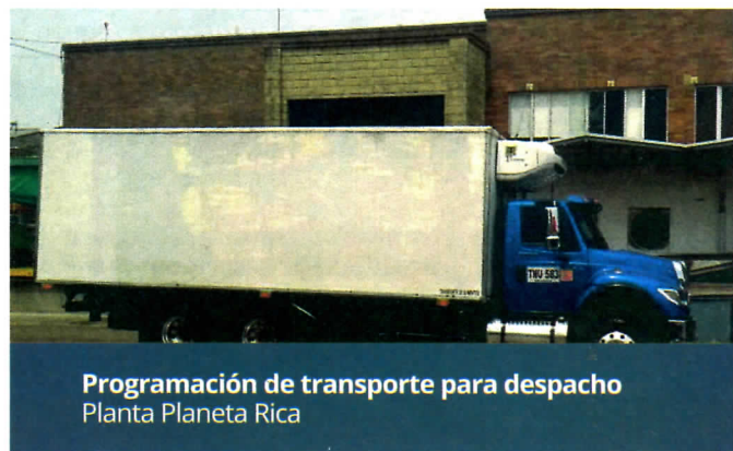
Programación de transporte para despacho Planta Planeta Rica