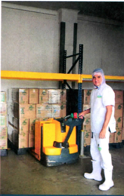
Entrega de productos Planta Medellín