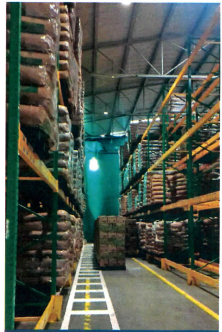
Ubicación de productos para almacenamiento Planta Pulverizadora San Pedro