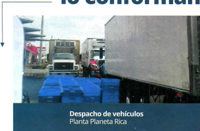
Despacho de vehículos Planta Planeta Rica