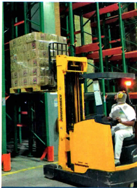
Inventario de productos Planta Funza