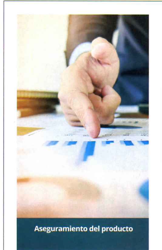
Aseguramiento del producto