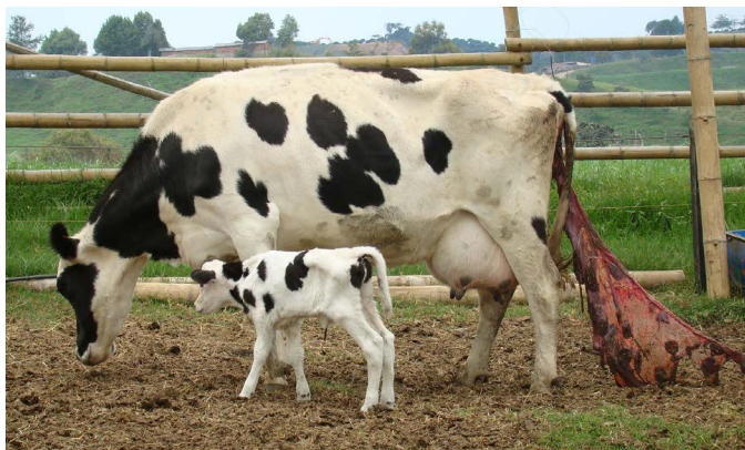
Figura 2. Retención de placenta por Brucelosis

Crédito foto polarización fluorescente. Foto. Instituto Colombiano Agropecuario (Ica). Tomada de https://goo.gl/jzVDvh