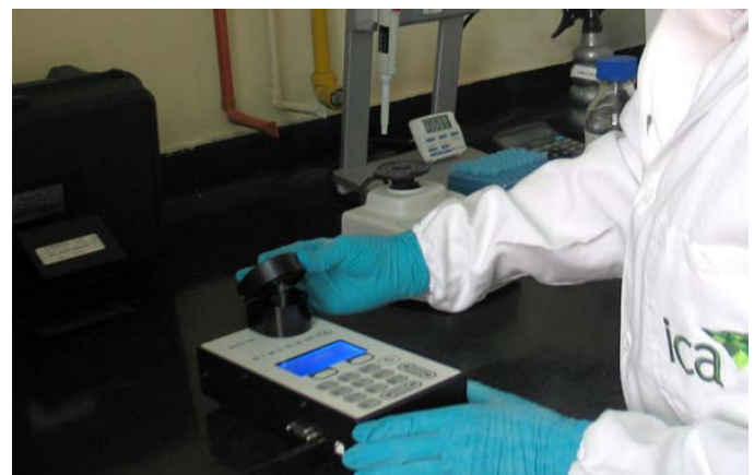
Figura 4. Técnica de polarización fluorescente