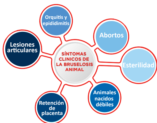
Figura 1: Síntomas clínicos de la brucelosis

En los rumiantes, la infección se adquiere mayormente por vía oral, nasal o conjuntival. Luego de haber atravesado las mucosas, Brucella se localiza en los ganglios linfáticos retrofaríngeos o submaxilares, entre los más frecuentes, para de allí diseminarse hacia otros órganos linfoides como el bazo, los ganglios ilíacos y los retromamarios. El periodo de incubación está relacionado con el estado fisiológico de la hembra. En la hembra no gestante, la bacteria puede permanecer localizada en los ganglios retromamarios. Durante la gestación, Brucella invade el útero en donde se multiplica masivamente y allí provoca una endometritis con ulceración de los espacios intercotiledonarios y compromiso de la membrana corioalantoidea, de los cotiledones placentarios, alojándose preferentemente en los trofoblastos eritrofagocíticos. En el caso de una primoinfección, el proceso culmina de modo característico por el aborto durante el último tercio de la gestación. La retención de placenta y la metritis son secuelas frecuentes (Figura 2). Rara vez el animal infectado aborta por segunda vez, sin embargo, quedan infectados, eliminando Brucella con cada parto. Los neonatos pueden infectarse en el útero (latencia o síndrome de las novillas), aunque con baja frecuencia. En el toro, la enfermedad se caracteriza por orquitis y/o epididimitis y, a menudo, también