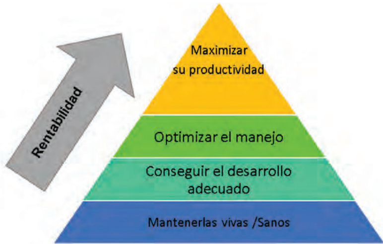
GRÁFICA 2. ¿CUÁL ES EL OBJETIVO EN LA CRIANZA DE TERNERAS?