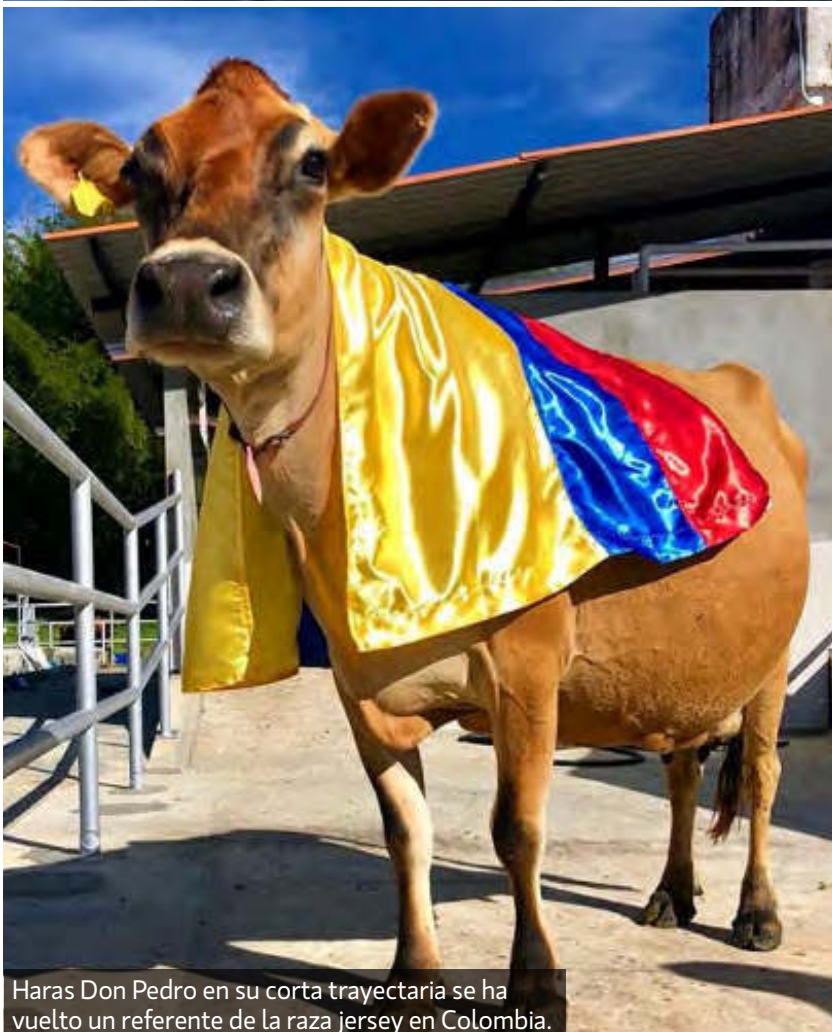
Haras Don Pedro en su corta trayectoria se ha vuelto un referente de la raza jersey en Colombia.