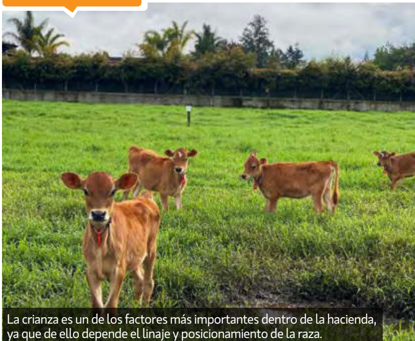
La crianza es un de los factores más importantes dentro de la hacienda, ya que de ello depende el linaje y posicionamiento de la raza.