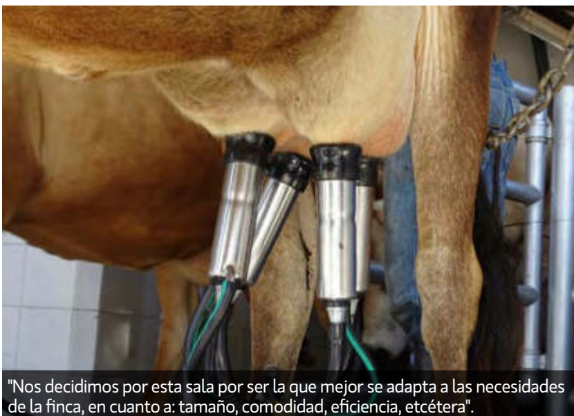
"Nos decidimos por esta sala por ser la que mejor se adapta a las necesidades de la finca, en cuanto a: tamaño, comodidad, eficiencia, etcétera".

Para el proceso reproductivo estamos utilizando inseminación artificial con los mejores toros de la raza Jersey a nivel mundial. Igualmente, se está trabajando la aspiración folicular, con cerca de 10 ejemplares al mes, y logrando una alta tasa de preñez de las vacas en producción. Para alcanzar este nivel hemos segregado el hato en dos grupos; vacas para exposición: inseminadas con los mejores toros tipo show, y vacas para producción: inseminadas con toros destacados en volumen de leche, altos en sólidos, salud de ubre y excelentes en conformación. Siempre, al seleccionar los toros para reproducción, se evalúa como prioridad el sistema mamario y se hace uso del semen sexado de los mejores toros genómicos, o probados con hijas. También destacamos que en la hacienda se encuentran algunas de las primeras hijas de los mejores toros genómicos Jersey”.