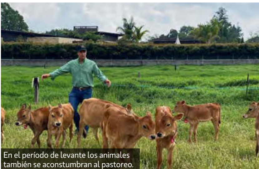
En el período de levante los animales también se acostumbran al pastoreo.