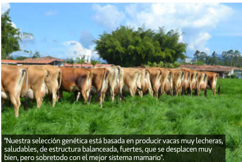
"Nuestra selección genética está basada en producir vacas muy lecheras, saludables, de estructura balanceada, fuertes, que se desplacen muy bien, pero sobretodo con el mejor sistema mamario".

nacional, esto nos ha llenado de orgullo para seguir con este linaje".