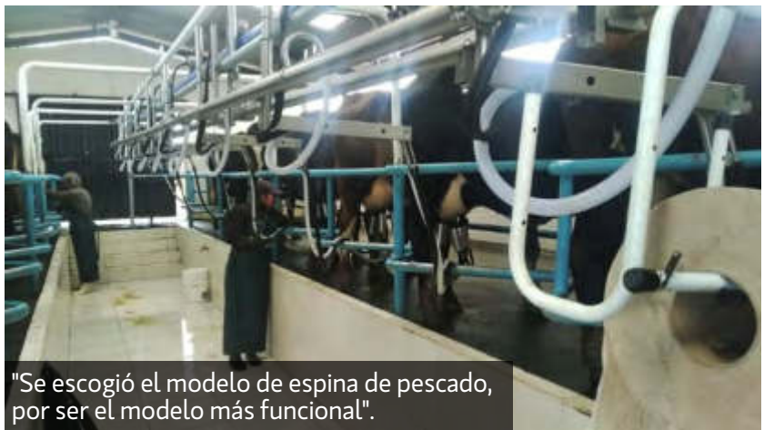
"Se escogió el modelo de espina de pescado, por ser el modelo más funcional".

y temperatura); sin embargo, por mencionar un promedio de rotación estamos en los 21 – 30 días. Insisto depende principalmente de la temperatura ambiental, además, manejamos tasas de crecimiento que van desde los 39 a los 105 kg/ms/día. Para acompañar toda la estrategia hacemos análisis de suelos constantemente para garantizar pasturas de buena calidad (ver tabla 1)".