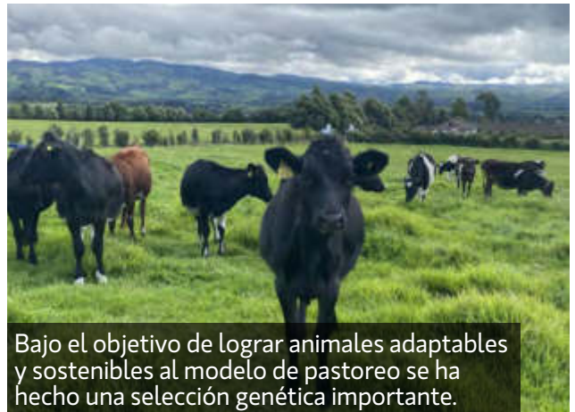
Bajo el objetivo de lograr animales adaptables y sostenibles al modelo de pastoreo se ha hecho una selección genética importante.