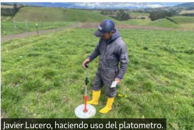
Javier Lucero, haciendo uso del platometro.