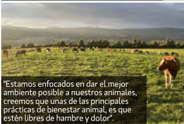
"Estamos enfocados en dar el mejor ambiente posible a nuestros animales, creemos que unas de las principales prácticas de bienestar animal, es que estén libres de hambre y dolor".