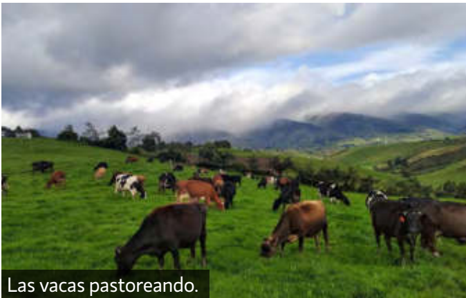
Las vacas pastoreando.