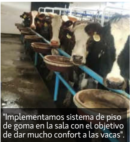
"Implementamos sistema de piso de goma en la sala con el objetivo de dar mucho confort a las vacas".