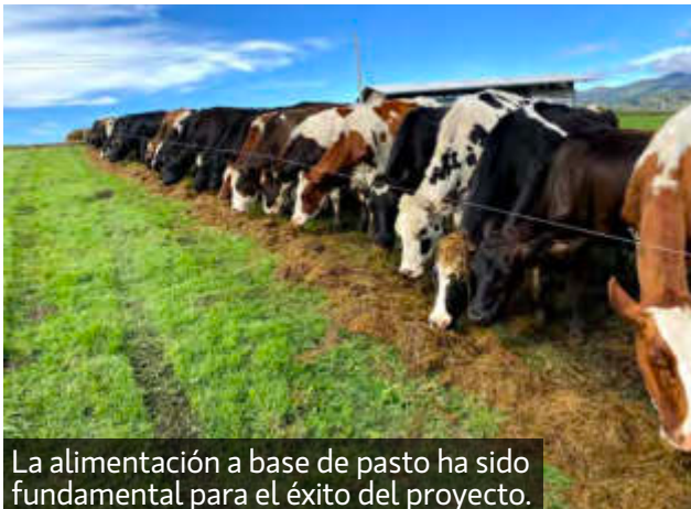
La alimentación a base de pasto ha sido fundamental para el éxito del proyecto.