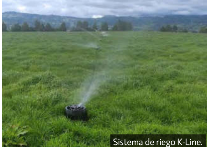
Sistema de riego K-Line.

visa todo el correcto funcionamiento del equipo de ordeño, rutina de ordeño, y se realizan pruebas rápidas de calidad sanitaria de leche".