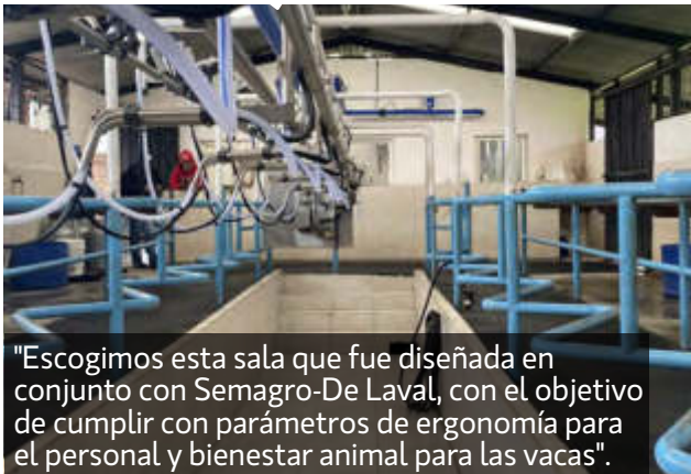
"Escogimos esta sala que fue diseñada en conjunto con Semagro-De Laval, con el objetivo de cumplir con parámetros de ergonomía para el personal y bienestar animal para las vacas".