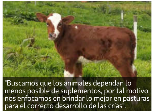
"Buscamos que los animales dependan lo menos posible de suplementos, por tal motivo nos enfocamos en brindar lo mejor en pasturas para el correcto desarrollo de las crías".