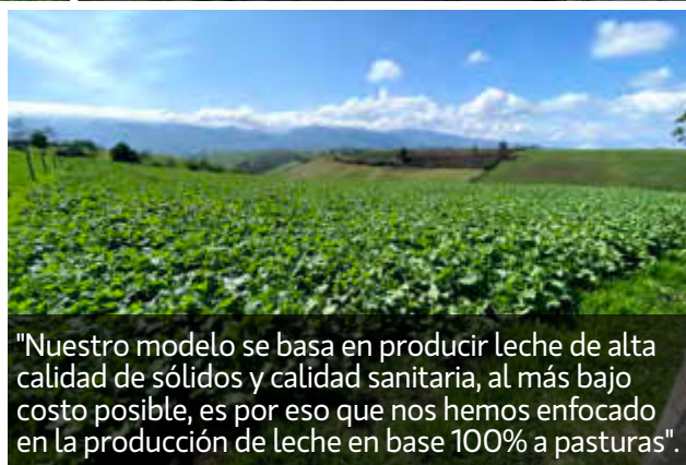
"Nuestro modelo se basa en producir leche de alta calidad de sólidos y calidad sanitaria, al más bajo costo posible, es por eso que nos hemos enfocado en la producción de leche en base 100% a pasturas".

de 2000 lt, con un sistema de lavado automático del equipo y sistema de calentamiento de agua a través del caldero Diesel. Escogimos esta sala que fue diseñada en conjunto con Semagro-De Laval, con el objetivo de cumplir con parámetros de ergonomía para el personal y bienestar animal para las vacas , se escogió el modelo de espina de pescado, por ser el modelo más funcional para el número de animales que en proyecto tenemos en la hacienda, y lograr así un ordeño rápido y eficiente".