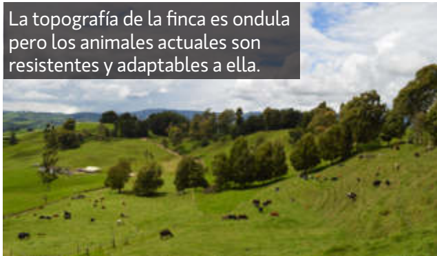
La topografía de la finca es ondulada pero los animales actuales son resistentes y adaptables a ella.