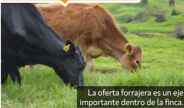
La oferta forrajera es un eje importante dentro de la finca.