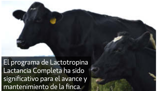
El programa de Lactotropina Lactancia Completa ha sido significativo para el avance y mantenimiento de la finca.