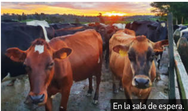
En la sala de espera.