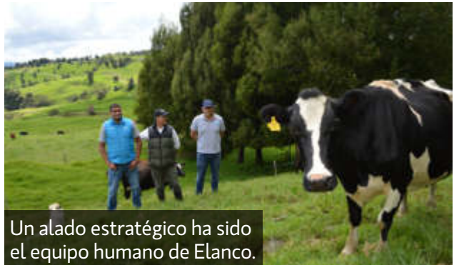
Un alado estratégico ha sido el equipo humano de Elanco.