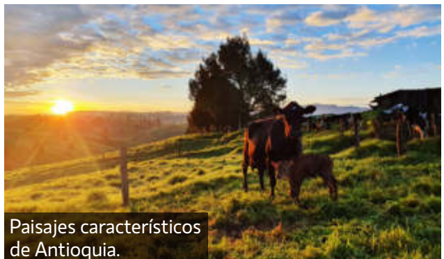
Paisajes característicos de Antioquia.

mencionaba anteriormente mi negocio al ser en una propiedad arrendada debe dar unos frutos importantes para el mantenimiento del mismo, es por ello que algunos litros demás me dan el