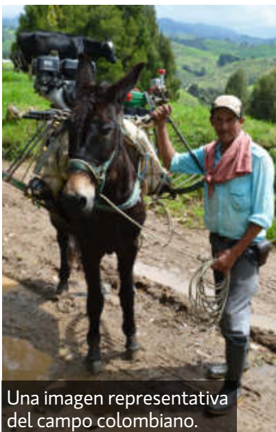
Una imagen representativa del campo colombiano.

de decisiones al ganadero. “Con este mes es el doceavo control que le hago a la finca, gracias a todos estos resultados hemos podido tomar decisiones con base en datos y evaluar qué es lo más conveniente para nuestra calidad y proyecto lechero”. En la gráfica 1 se observa los datos obtenidos de manera general de la finca, allí se determina que se debe mejorar y qué está en proceso de mejoramiento, asimismo se le hace un análisis económico de las pérdidas estimadas que puede tener el pro-