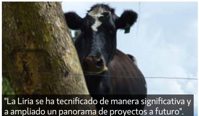
"La Liria se ha tecnificado de manera significativa y a ampliado un panorama de proyectos a futuro".