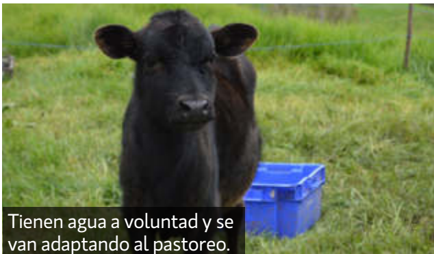
Tienen agua a voluntad y se van adaptando al pastoreo.