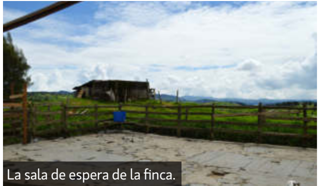
La sala de espera de la finca.