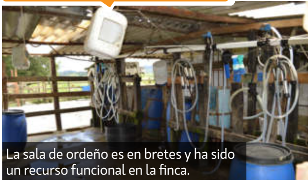
La sala de ordeño es en bretes y ha sido un recurso funcional en la finca.