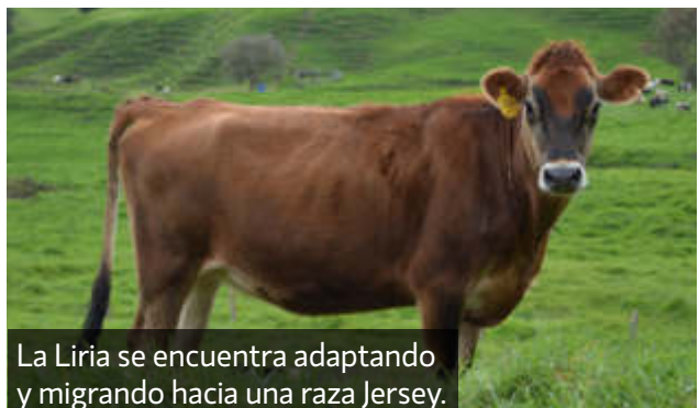
La Liria se encuentra adaptando y migrando hacia una raza Jersey.