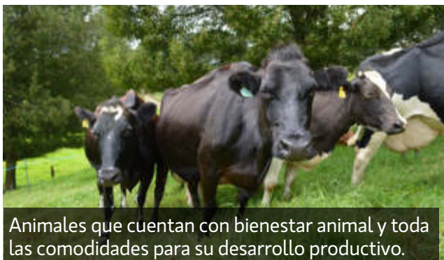
Animales que cuentan con bienestar animal y todas las comodidades para su desarrollo productivo.