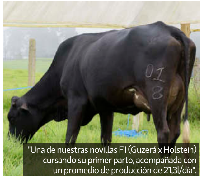
"Una de nuestras novillas F1 (Guzerá x Holstein) cursando su primer parto, acompañada con un promedio de producción de 21,3l/día".