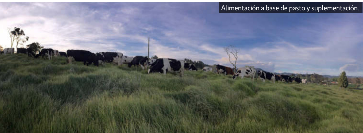
Alimentación a base de pasto y suplementación.

La crianza se ha vuelto esencial para garantizar el linaje de Las Margaritas, por ello su manejo es básico pero estricto, cuidando todos los puntos para obtener resultados significativos, por ejemplo; la tasa de mortalidad actualmente es de 1,3% una cifra bastante baja en comparación a otros modelos.