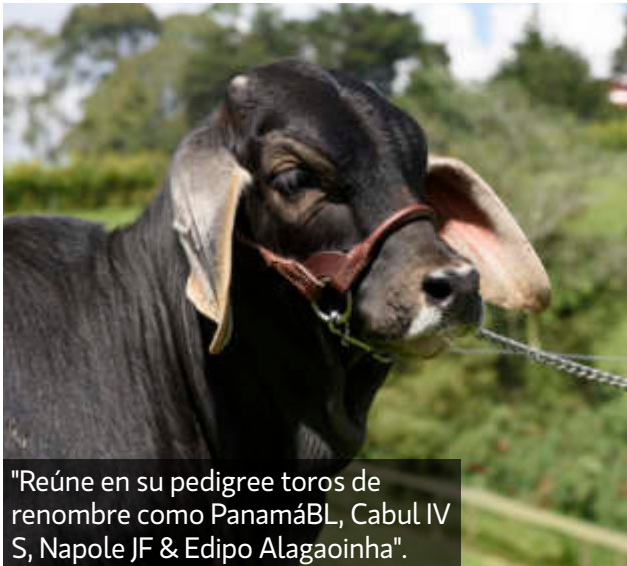
"Reúne en su pedigree toros de renombre como PanamáBL, Cabul IV S, Napole JF & Edipo Alagoinha".