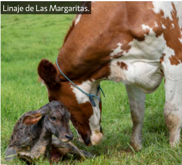
Linaje de Las Margaritas.