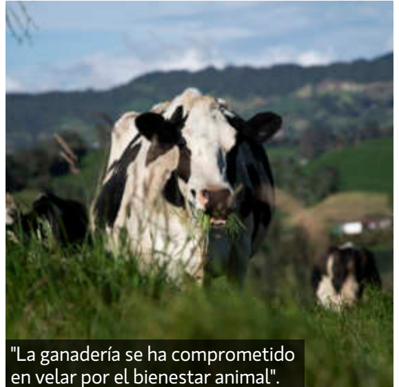
"La ganadería se ha comprometido en velar por el bienestar animal".

requerimientos fisiológicos para la edad, especialmente con concentrado y sal mineral. En vacas de producción se maneja una relación de 4l de leche por 1kg de concentrado en promedio, esto dependerá del momento de lactancia de la vaca, donde dicha relación podrá achicarse o en lo contrario ampliarse".