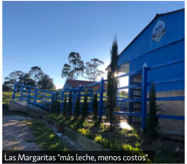
Las Margaritas "más leche, menos costos".

“EN LAS MARGARITAS NOS DIFERENCIAMOS POR LA CALIDAD HUMANA DENTRO DEL EQUIPO DE TRABAJO, ACOMPAÑADO DE UN BUEN SERVICIO Y ACOMPAÑAMIENTO PRE Y POST VENTA”.