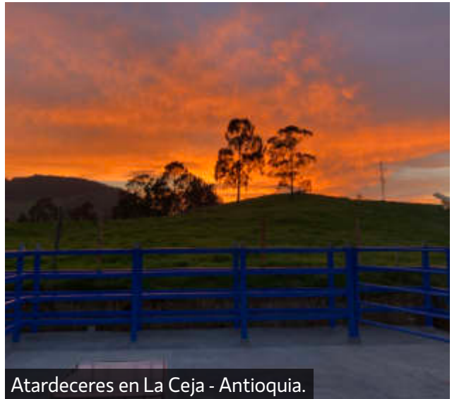
Atardeceres en La Ceja - Antioquia.

son: estar libre de sed, hambre y desnutrición; estar libre de molestias físicas o térmicas; estar libre de dolor, lesiones o enfermedades; ser libre para expresar las pautas propias de comportamiento; y finalmente estar libre de miedos y angustias".