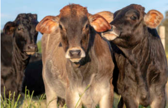
"Con tan solo cuatro meses de edad estas tres hembras se van perfilando para un futuro promisorio en nuestro hato".