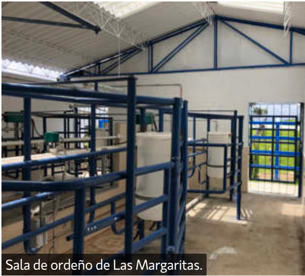
Sala de ordeño de Las Margaritas.