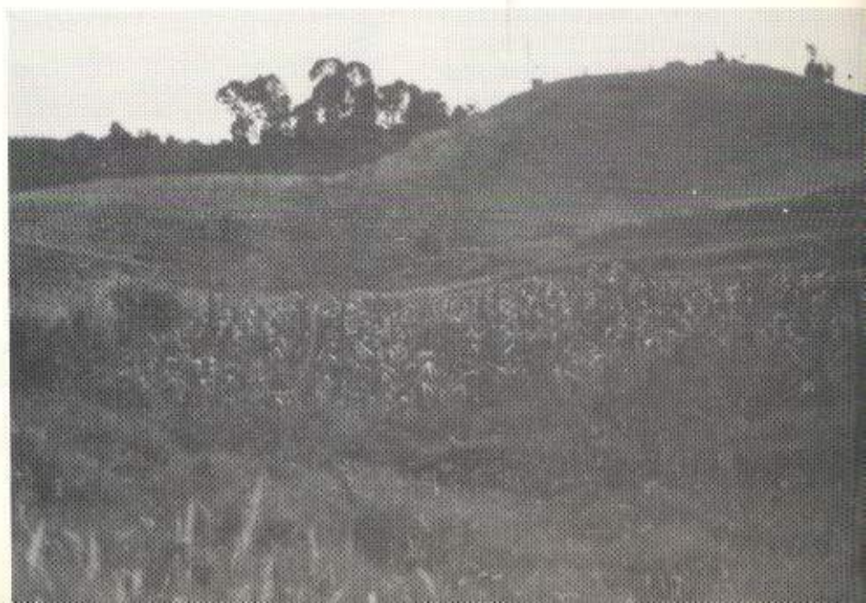
Cultivos de maíz, en Aragón, a 2.500 m.s.n.m

En un análisis de datos obtenidos en la Sabana de Bogotá (Tiabitata y aeropuerto El Dorado), se comparan las temperaturas mínimas tomadas a 2 m del suelo (caseta meteorológica estándar) y las temperaturas mínimas tomadas a 10 cm del suelo, se conclu-