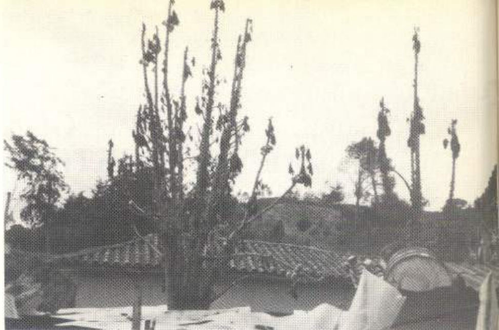
Aspecto de un papayuelo, después de las heladas

Es usual que los periódicos del país reporten, durante los meses de verano, la ocurrencia de heladas en las zonas frías de Boyacá, Cundinamarca y Nariño. Lo que no aparece muy frecuentemente en los diarios, es información acerca de la presencia de estos fenómenos en el Departamento de Antioquia.