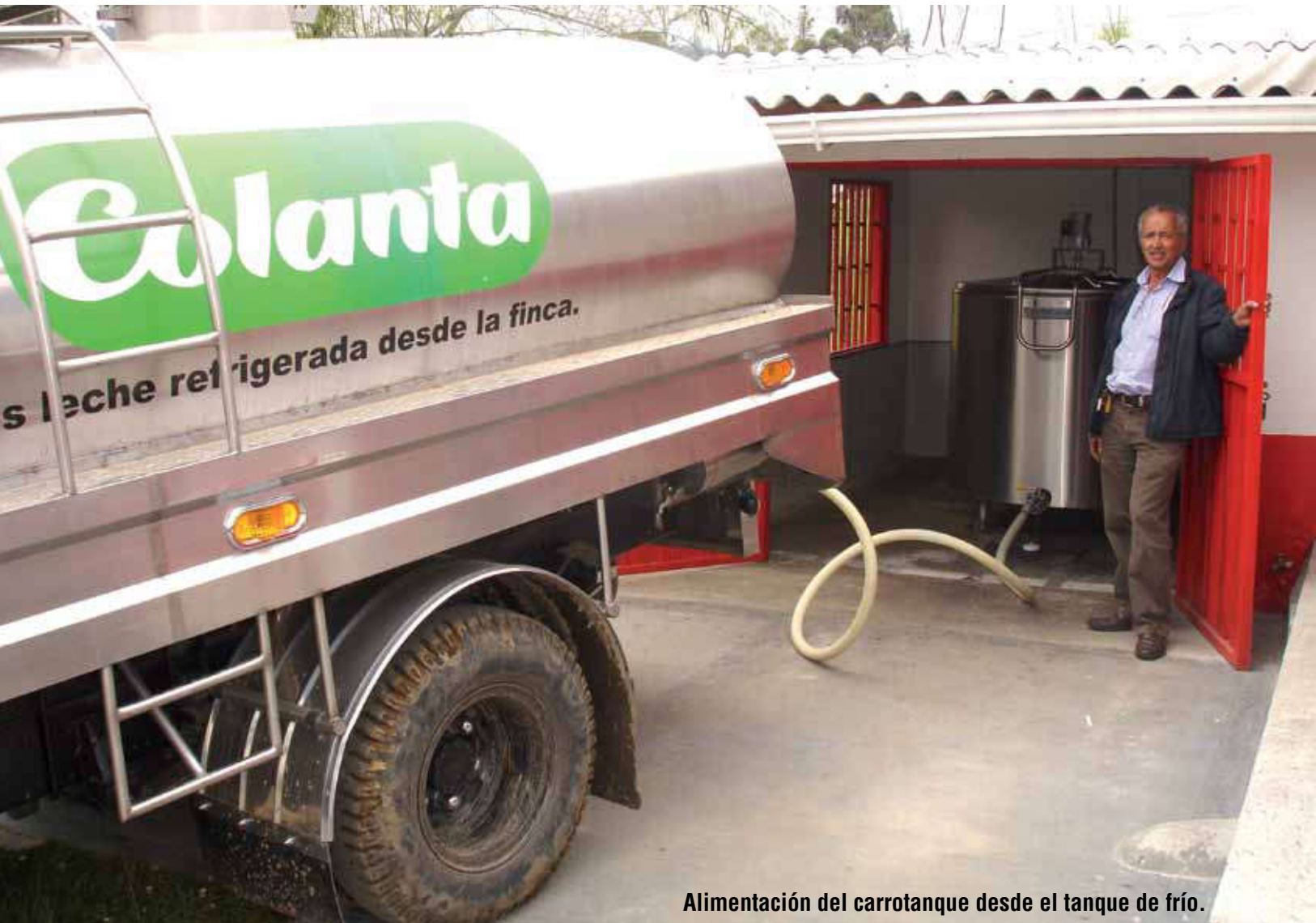
Alimentación del carrotanque desde el tanque de frío.