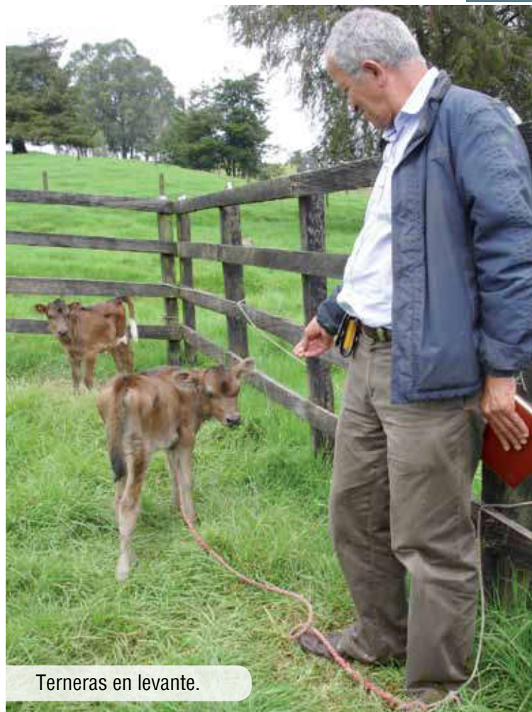
Terneritas en levante.

Con una expresión en su rostro que mezclaba la tranquilidad de aquel quien cumple con su deber, la gratitud por la ayuda que ha recibido de La Cooperativa y la satisfacción de los logros que ha conseguido; Don Álvaro dice adiós.