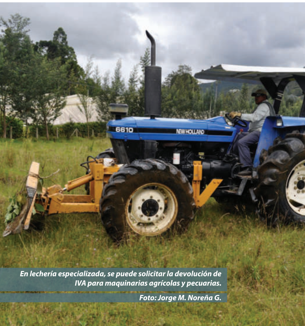
En lechería especializada, se puede solicitar la devolución de IVA para maquinarias agrícolas y pecuarias.

• La administración de impuestos, para mejorar sus controles y minimizar la posibilidad de devolver dineros no procedentes, debe considerar los consumos por animal, sea bovino, porcino, ave, o cualquier otra especie. El sector tiene información importante que permite que estos registros se puedan estandarizar. En la actualidad podemos saber en promedio cuánto consume un cerdo hasta el momento de ir al beneficio y cuánto alimento se suministra a una vaca en lechería especializada por litro de leche producido.