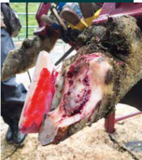
Absceso de línea blanca

Los tratamientos en estos animales problema ( toros reproductores y vacas ) son costosos para la empresa y muy complejos para nosotros como veterinarios especialistas en el tema; más aún cuando nos reportan situaciones que llevan mucho tiempo en su evolución, es decir, cojeras crónicas .