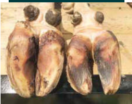
2. Recorte incorrecto y malas prácticas en el mismo