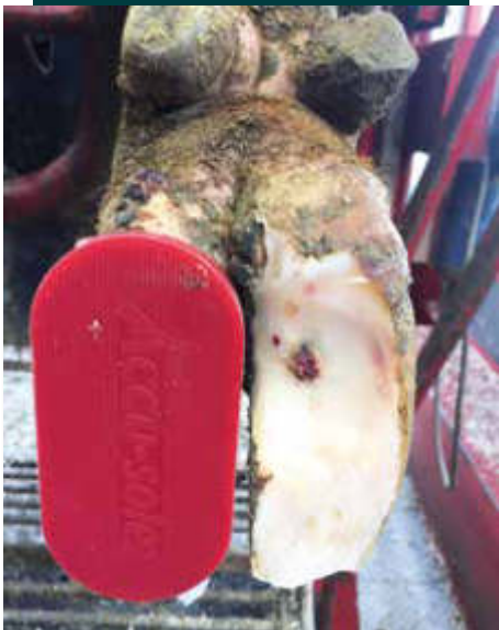
Úlcera de suela