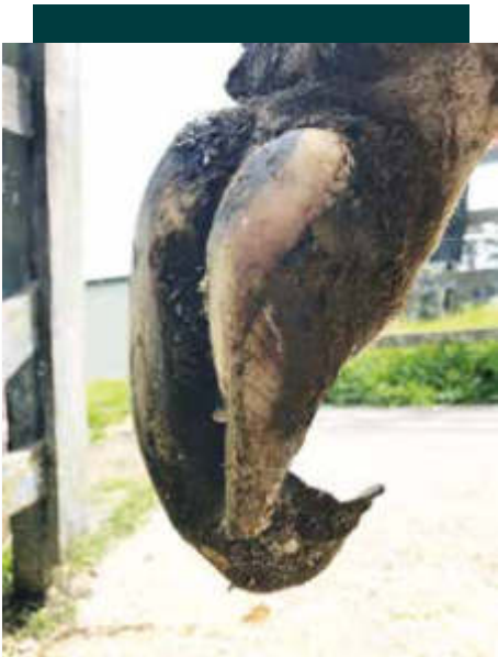
1. Falta de recorte preventivo

Existen dos causas para que el ganado experimente cambios no deseados en sus pezuñas: