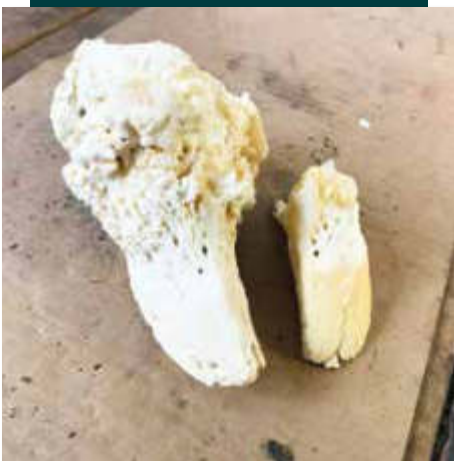
3ra Falange afectada