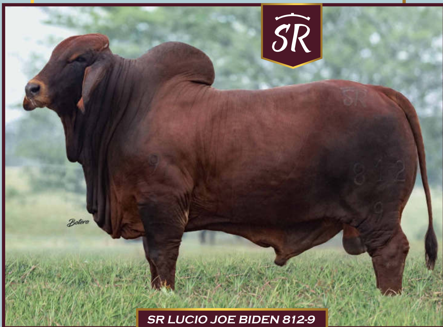
SR LUCIO JOE BIDEN 812-9

Cuenta con tres generaciones propias netamente seleccionadas y criadas en su hato que hacen que Ganadería San Rafael , esté, ¡a otro nivel!.