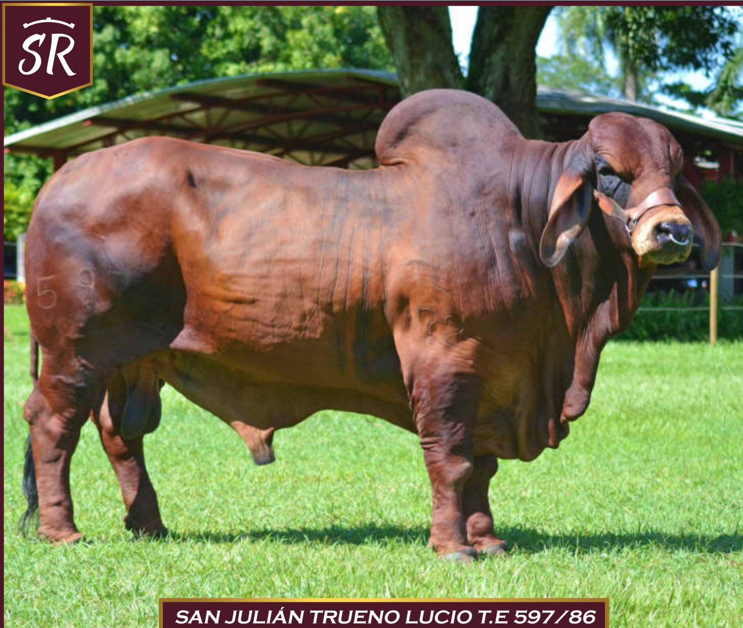
SAN JULIÁN TRUENO LUCIO T.E 597/86

Lucio , el papá de Alana es hijo de Monterrey Tanque Trueno 972/8 , cuyos padres son Lusitania MR Millonario 1562/14 y MT Millonario Elena 111/6 . La madre de Lucio es la vaca San Julián Winchester 290 , hija del toro MR Winchester Magnum 999/3 en la vaca San Julián Miss Remedy 096/46 . Lucio , criado por Hacienda San Julián es propiedad actual de Ganadería San Rafael , es un toro que transmite el color rojo cerezo, casta, obligos, musculatura, estructura y mucha caracterización racial. Su fertilidad es asombrosa. Cualquiera de sus hijas, da entre 15 a 20 embriones por lavado.