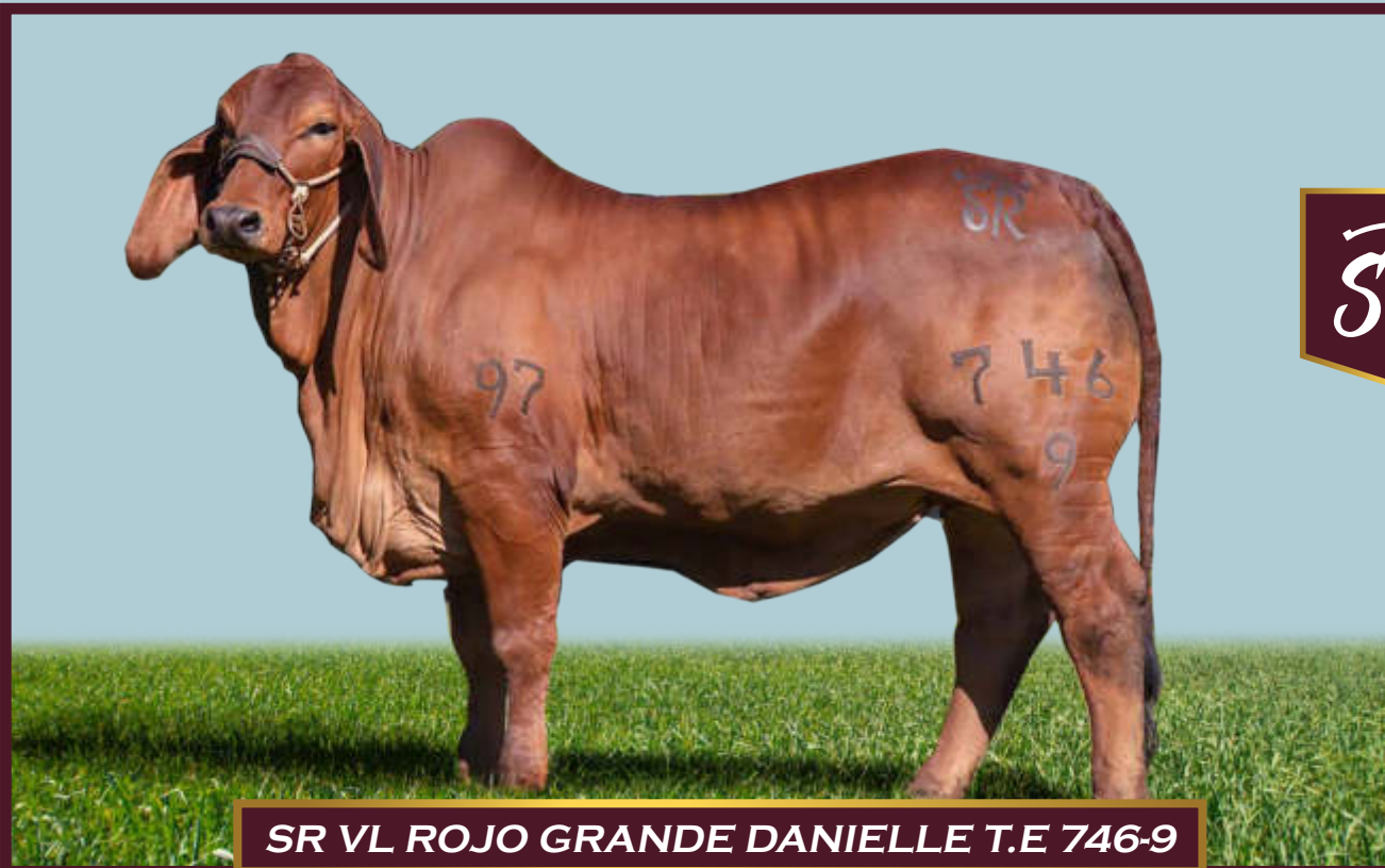
SR VL ROJO GRANDE DANIELLE T.E 746-9

Esas 120 donadoras han sido trabajadas con sangre de esos toros legendarios y con sangre de toros nacionales ( colombianos ), destacándose: El Caney Palmar Napoleón 295/9 , toro que hace una década era el que más hijos registrados tenía en Asocebú y que lo han trabajaron 280 ganaderías diferentes en Colombia. Su padre: El Palmar 449 y su madre: Lady Suville 31/5 .