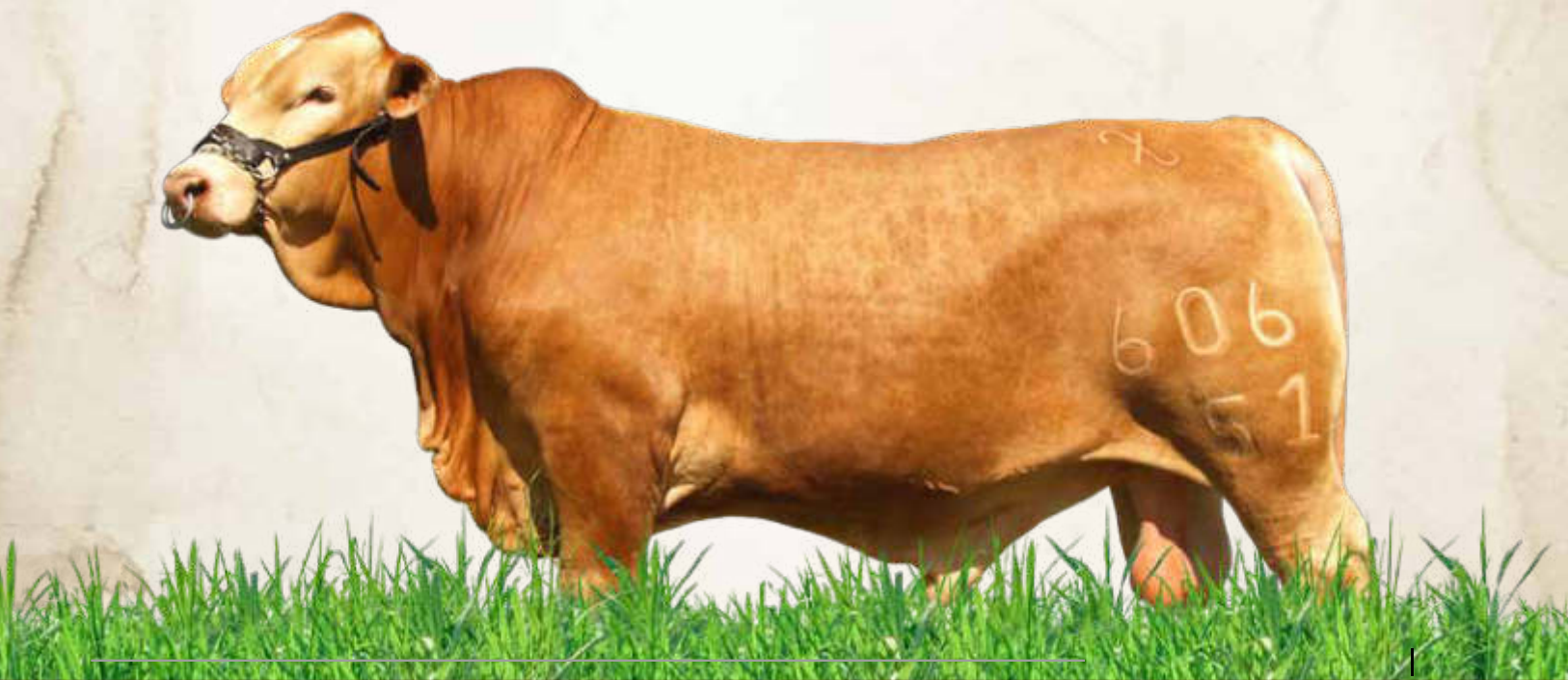
Las Américas 606/51 Campeón Joven Reservado, Bucaramanga 2022