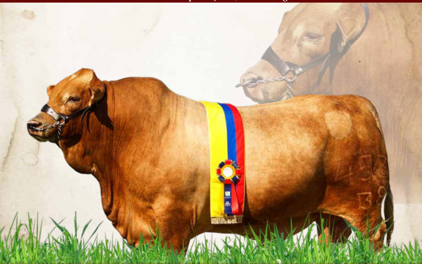
Las Américas 453/38 Campeón Senior y Gran Campeón, Bucaramanga 2022