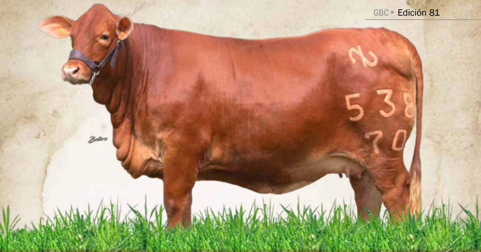
Las Américas 538/70 Campeona Reservada, Bucaramanga 2022