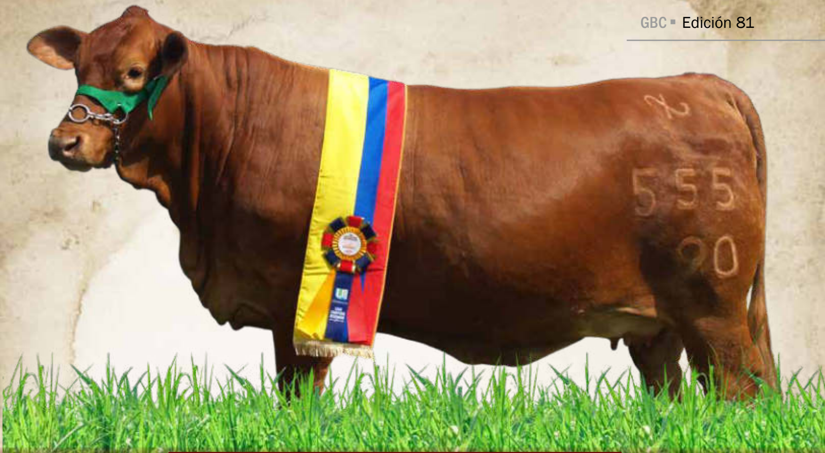
Las Américas 555/90 Campeona Joven, Bucaramanga 2022