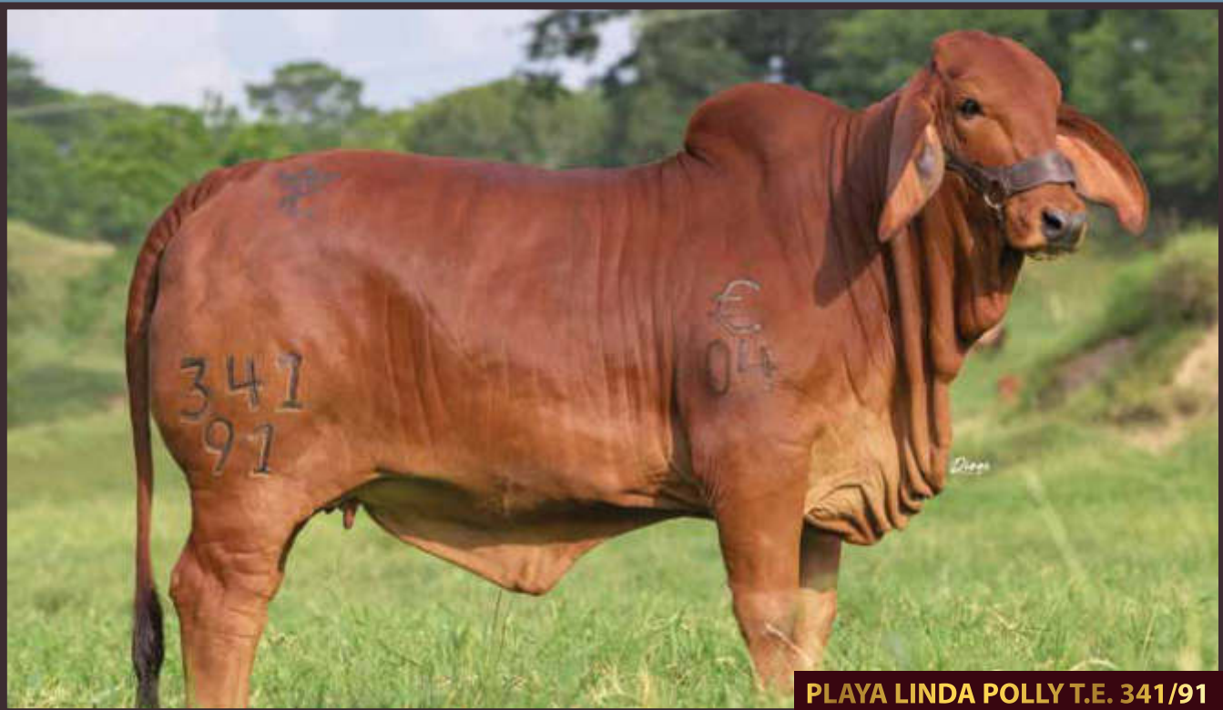
PLAYA LINDA POLLY T.E. 341/91

En nuestro portafolio de ganado puro de Brahman Rojo encontrarán: hembras de levante, novillas de vientre, toretes reproductores, semen, embriones nacidos o transferidos en sus respectivas receptoras, derechos de aspiración de nuestras donadoras; ganados tanto de potrero como de cabezal con la garantía y el sello de productividad PL .