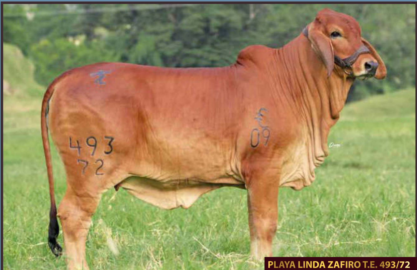
PLAYA LINDA ZAFIRO T.E. 493/72

Por su parte, en ganado comercial encontrarán: hembras y machos con muchísima caracterización, números positivos y una excelente funcionalidad lo que se traduce en productividad en el potrero; ejemplares, con el PLUS de nuestro trabajo de clasificación Asocebú .