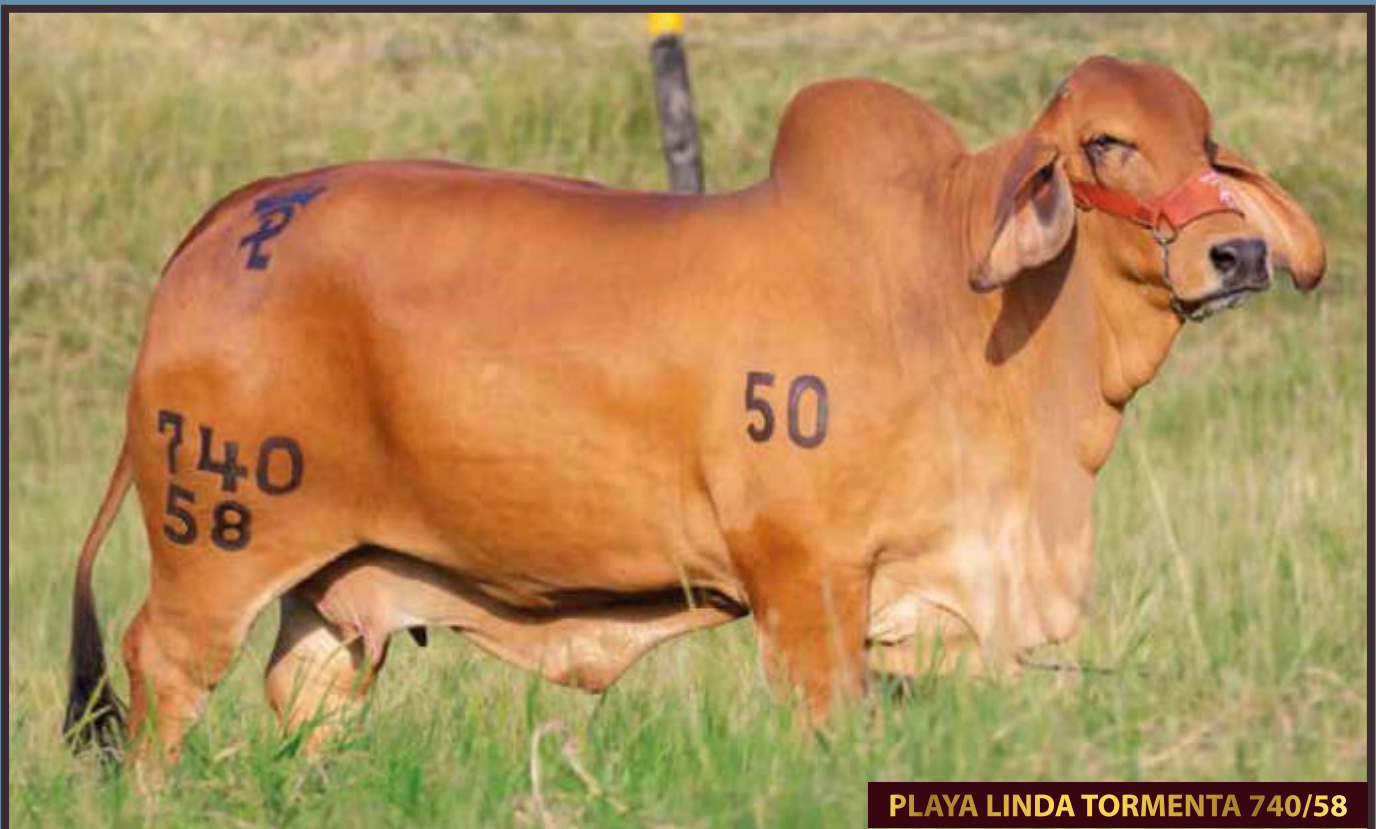
PLAYA LINDA TORMENTA 740/58

Algo no menos importante que nuestro trabajo ganadero es el compromiso ambiental y social en lo cual nos enfocamos arduamente. En lo ambiental se realizan diferentes actividades como: conservación de bosques, resiembra de especies nativas, cuidado y preservación de las fuentes hídricas, recuperación de fauna. Por su parte, en lo social trabajamos siempre de la mano con las comunidades tratando de impactar de manera positiva para generar empleos directos e indirectos, ayudar en programas sociales y participar del desarrollo rural del país.