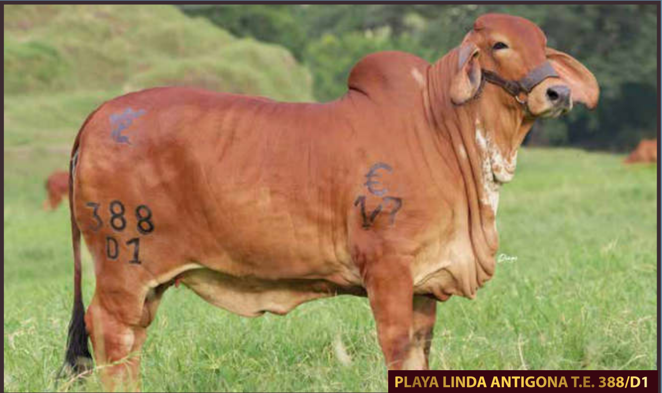
PLAYA LINDA ANTIGONA T.E. 388/D1

Algo no menos importante que nuestro trabajo ganadero es el compromiso ambiental y social en lo cual nos enfocamos arduamente. En lo ambiental se realizan diferentes actividades como: conservación de bosques, resiembra de especies nativas, cuidado y preservación de las fuentes hídricas, recuperación de fauna. Por su parte, en lo social trabajamos siempre de la mano con las comunidades tratando de impactar de manera positiva para generar empleos directos e indirectos, ayudar en programas sociales y participar del desarrollo rural del país.