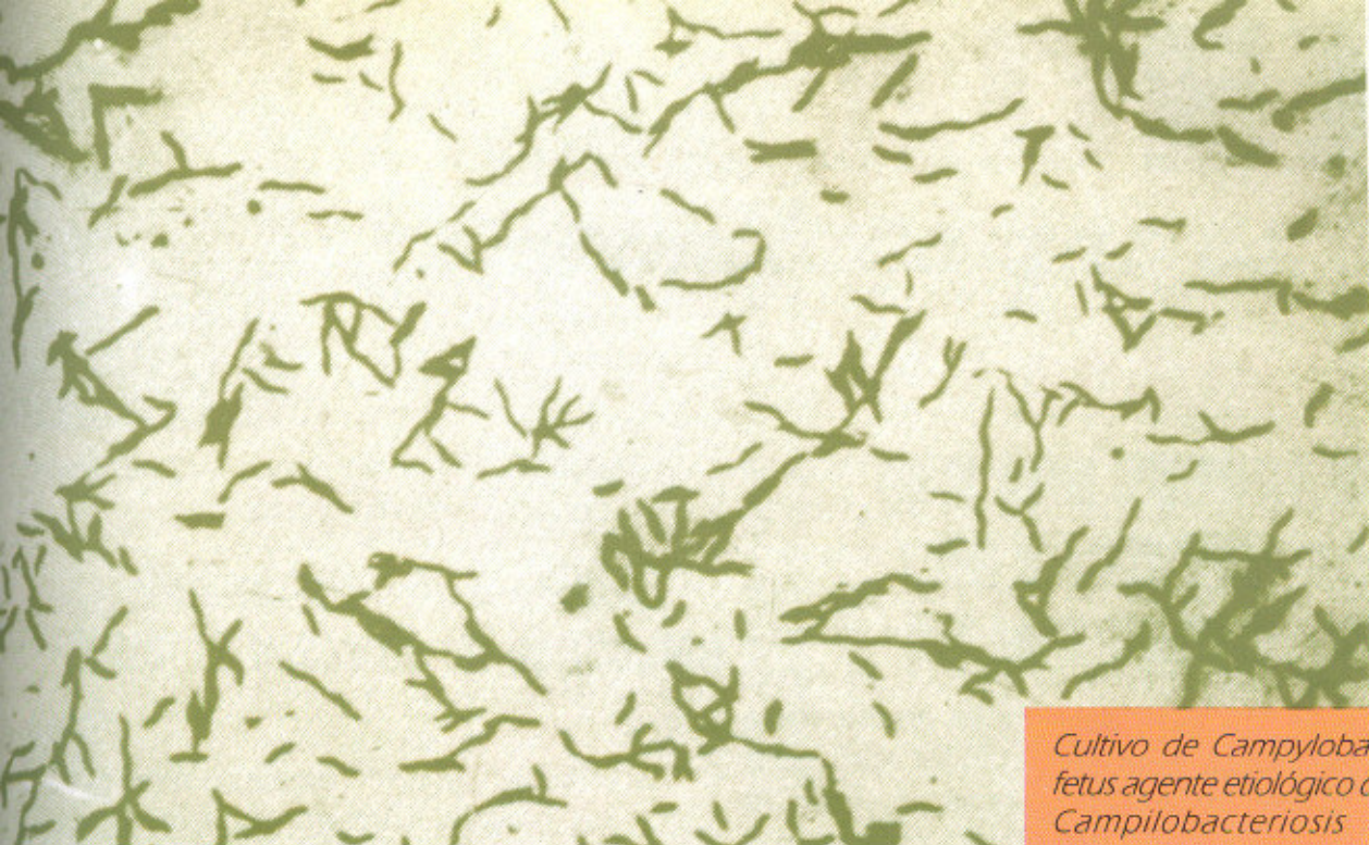
Cultivo de Campylobacter fetus agente etiológico de la Campilobacteriosis o Vibriosis genital.

Campy - thio y el medio Tiol que permiten que el germen sobreviva en ellos hasta por varios días antes de ser sembrados en el laboratorio.