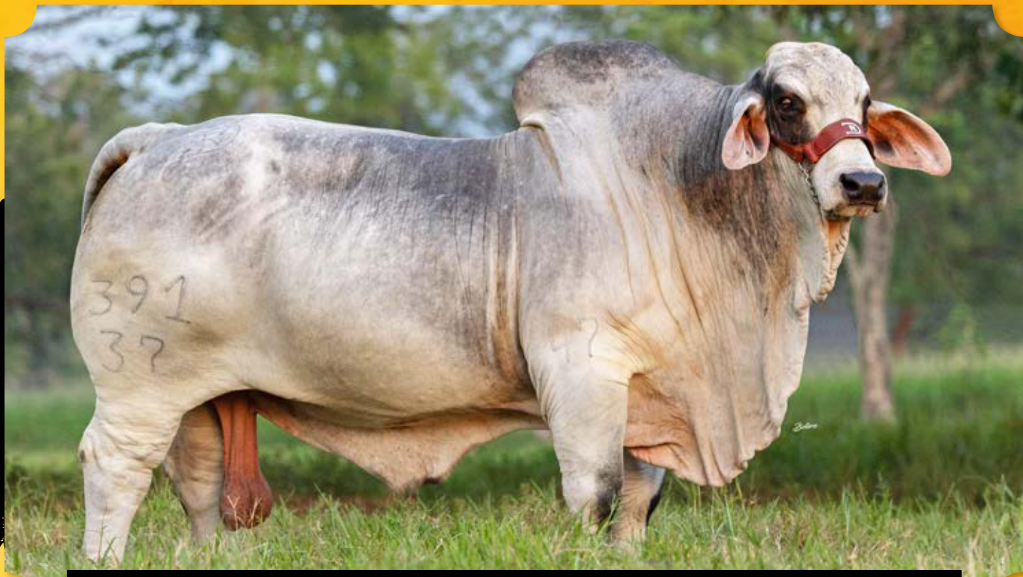
RD Neptuno 391/37 (Liberty x Wellington) Padre Sobresaliente y padre de la Gran Campeona 2023

Ganadería RD es una empresa familiar que lleva tres generaciones dedicadas a la cría de ganado puro. Inició en la Hacienda Normandía en Lebrija, Santander con ganado Pardo Suizo , donde obtuvimos grandes reconocimientos a nivel nacional gracias a los excelentes números de nuestra lechería y gran cantidad de triunfos en las exposiciones. A principios de los años 90 compramos la Hacienda Agualinda en San Alberto, Cesar, localizada a 80 m.s.n.m, 29°C en promedio y 2.000 mm de lluvias por año. En verano la temperatura sube hasta 36°C.