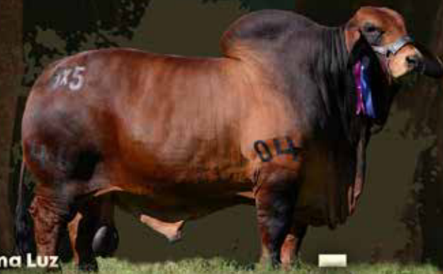
Ana Luz JALAPEÑO Vendaval x Tola